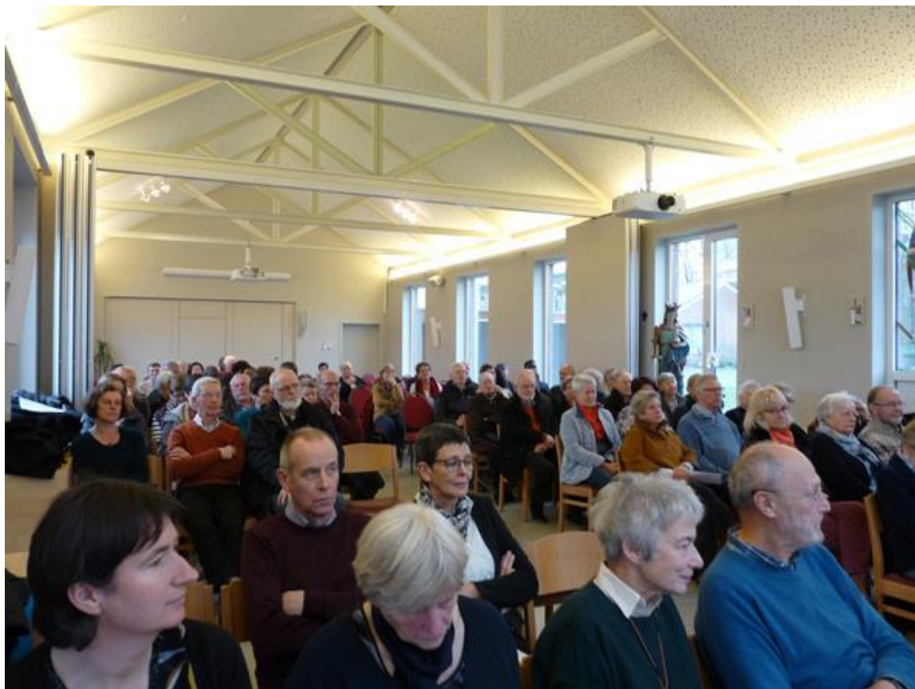
We vierden samen: Ter Elfder Ure, de Protestantse Kerk van Hasselt, Het Veer.